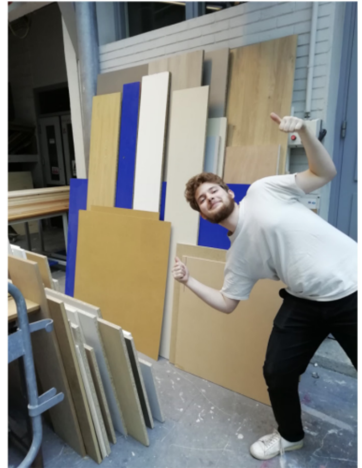
Récupération des chutes de la menuiserie Gueguan et utilisation du stock préexistant de la Malle.